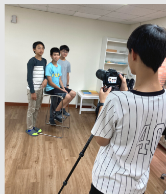
第四學季 | 攝影