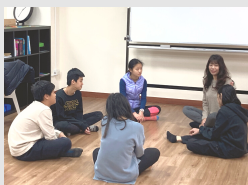
第三學季 | 戲劇與肢體