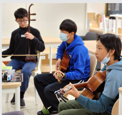
第三學季 | 音樂與作曲