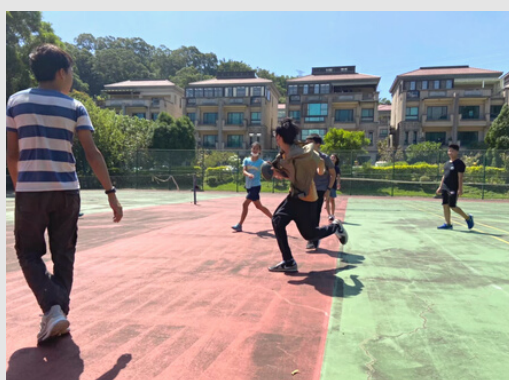
全年 | 體育