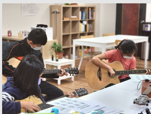
第二學季 | 音樂 (吉他)