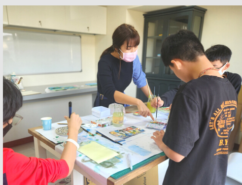
第二學季 | 水彩

我們依當下學生人數，邀請一至數位外部專業老師前來授課，盡可能讓學生有多元探索的機會；以下照片為 2022-23 學年「自我表達」的課程片段。